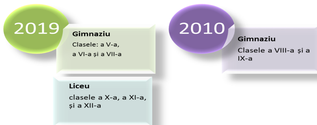
Fig. 1. Implementarea curricula 2010, 2019 la disciplina limba și literatura română

Procesul educațional la disciplina limba și literatura română în anul de studii 2021-2022 se va desfășura în baza a două curricula, 2010 și 2019. Implementarea curriculumului