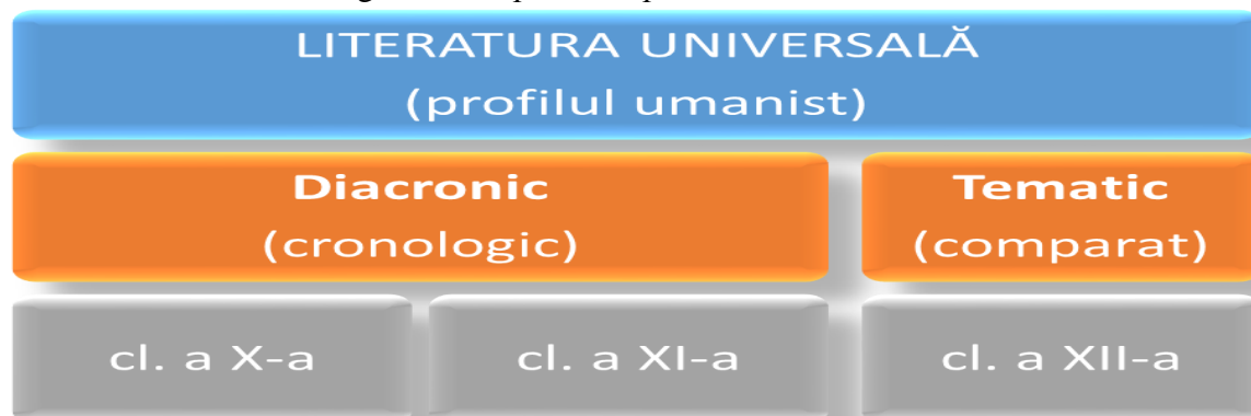
Fig. 2. Conceptul disciplinei literatura universală

Numărul de ore alocat pentru disciplina literatura universală, profilul umanist, atât în școala cu predare în limba română, cât și în limba minorităților naționale, este asigurată în strictă conformitate cu Planului-cadru pentru învățământul primar, gimnazial și liceal în anul de studii 2021-2022 (aprobat prin ordinul Ministrului Educației, Culturii și Cercetării, nr. 200 din 26.02.2021).