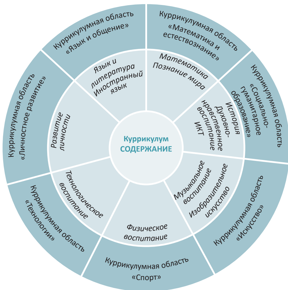
Фигура 2. Система учебных содержаний куррикулума для начального образования

Система учебных содержаний куррикулума для начального образования (в широком смысле), структурирована по куррикулумным областям и учебным дисциплинам, предназначенным для обеспечения формирования компетенций. Предметное содержание (в узком смысле) включает знания (теории, законы, закономерности, факты, феномены, процессы, данные и т.д.) и человеческие ценности .