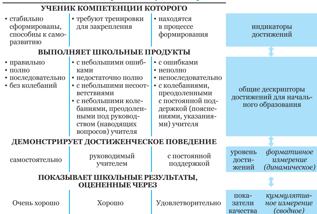
Фигура 1. Оценивание школьных результатов в контексте КОД (согласно Куррикулуму для начального образования)